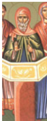
Όσιος Λάζαρος ο Θαυματουργός, ο Γαλιθσιώτης