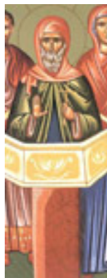
Όσιος Λάζαρος ο Θαυματουργός, ο Γαλλησιώτης