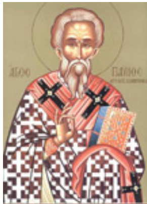
Άγιος Παύλος Α' <br /> Αρχιεπίσκοπος Κωνσταντινούπολης