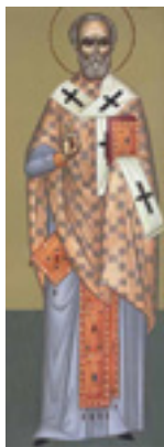
Άγιος Συμεών επίσκοπος Περσίας