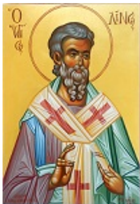
Άγιος Λίνος - Μιχαήλ Χατζημιχαήλ© www.michaelhadjimichael.com