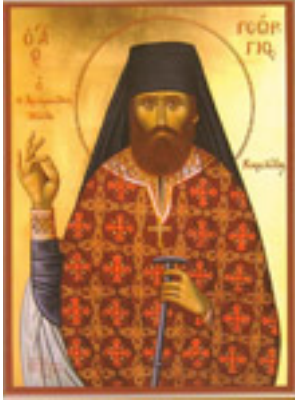
Όσιος Γεώργιος Καρσλίδης ο Ομολογητής