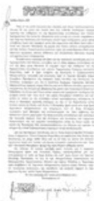
Πατριαρχική Πράξη Αγιοκατατάξεως του Οσίου Γεωργίου Καρσλίδη