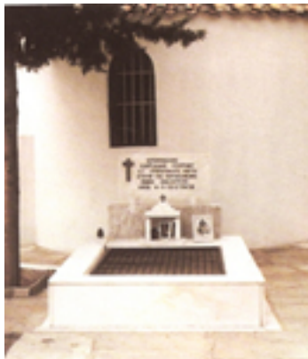
Ο τάφος του Οσίου Γεωργίου Καρσλίδη (πριν την ανακομιδή των λειψάνων του), ο οποίος βρίσκεται στην Ιερά Μονή Αναλήψεως, Ταξιαρχών (Σίψα) Δράμας