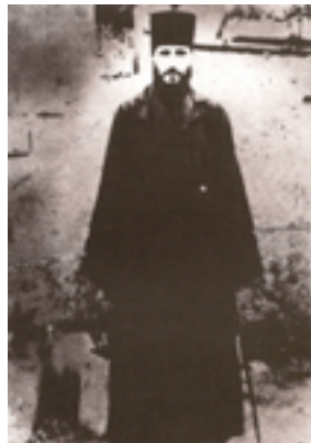
Ο Όσιος Γεώργιος Καρσλίδης λίγο πριν την αναχώρησή του από την Ρωσία.