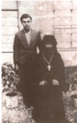
Ο Όσιος Γεώργιος Καρσλίδης με πνευματικό του τέκνο.