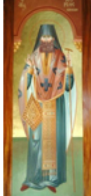
Όσιος Γεώργιος Καρσλίδης ο Ομολογητής