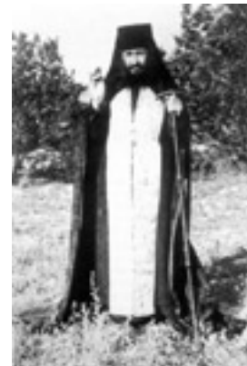
Όσιος Γεώργιος Καρσλίδης ο Ομολογητής