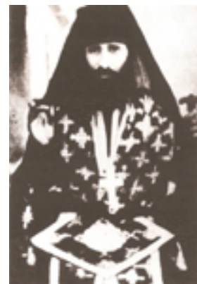
Ο Όσιος Γεώργιος Καρσλίδης ως λειτουργός το 1936 μ.Χ.