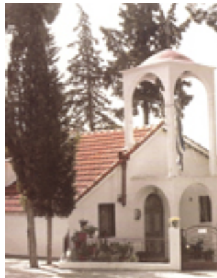
Ο παλιός ναός της Αναλήψεως με τα δύο κελλιά του Οσίου Γεωργίου Καρσλίδη.