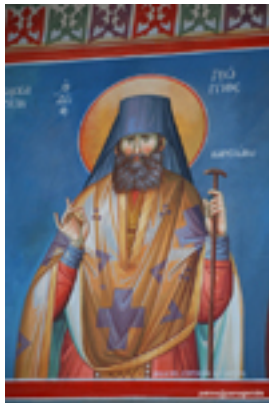
Όσιος Γεώργιος Καρσλίδης ο Ομολογητής (Εκκλησιάκι της Παντάνασσας στον Άγιο Νικόλαο της Βιστωνίδας)