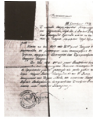
Όσιος Γεώργιος Καρσλίδης ο Ομολογητής Κατά την κουρά του (1919 μ.Χ.) ονομάζεται Συμεών. Στην φωτογραφία το πιστοποιητικό της κουράς και της χειροτονείας του