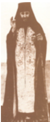
Όσιος Γεώργιος Καρσλίδης ο Ομολογητής