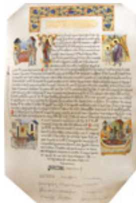
Πατριαρχική Πράξη Αγιοκατατάξεως του Οσίου Γεωργίου Καρσλίδη