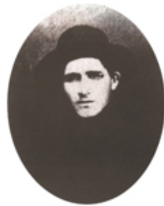
Οι διώξεις της Εκκλησίας από το άθεο καθεστώς της επανάστασης του 1917 μ.Χ. και οι φυλακίσεις, τον ανάγκασαν να έρθει το 1929 μ.Χ. στην Ελλάδα. Φωτογραφίζεται ως λαϊκός κατ'ανάγκη στην ηλικία των 28 ετών κατά την αναχώρησή του από την Ρωσία.