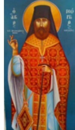
Όσιος Γεώργιος Καρσλίδης ο Ομολογητής