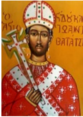
Άγιος Ιωάννης ο Βατατζής ο ελεήμονας βασιλιάς - Δια χειρός Μαριλένας Φωκά