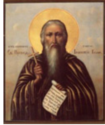
Ἵσιος Ἰωαννίκιος ο Μεγάλος «ὁ ἐν Ὀλύμπω»