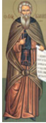
Ἵσιος Ἰωαννίκιος ο Μεγάλος «ὁ ἐν Ὀλύμπω»