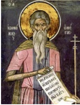
Ἵσιος Ἰωαννίκιος ο Μεγάλος «ὁ ἐν Ὀλύμπω»