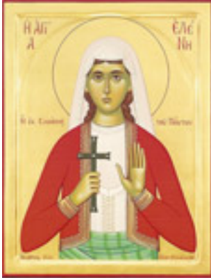
Αγία Ελένη η Παρθενομάρτυς από τη Σινώπη