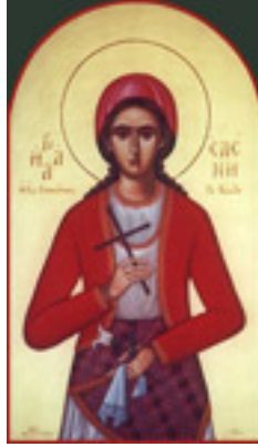
Αγία Ελένη η Παρθενομάρτυς από τη Σινώπη