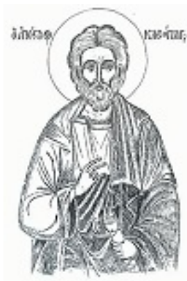
Άγιος Κλεόπας ο Απόστολος