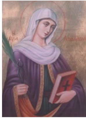
Αγία Απολλωνία, η Παρθένος