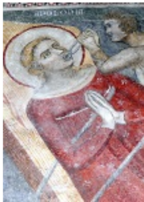
Το μαρτύριο της Αγίας Απολλωνίας της Παρθένου