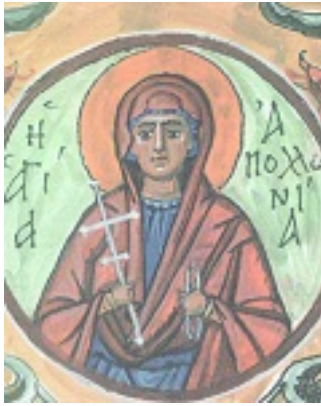
Αγία Απολλωνία, η Παρθένος