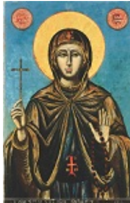
Αγία Αναστασία η Ρωμαία