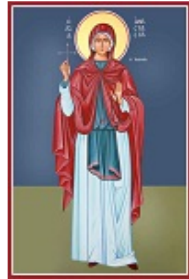
Αγία Αναστασία η Ρωμαία - Καζακίδου Μαρία© (byzantineartkazakidou. blogspot.com)