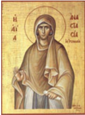
Αγία Αναστασία η Ρωμαία