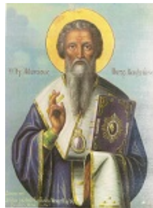
Όσιος Αθανάσιος Α' Πατριάρχης Κωνσταντινούπολης