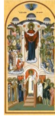
Αγία Σκέπη της Υπεραγίας Θεοτόκου Αγία Σκέπη της Υπεραγίας Θεοτόκου Αγία Σκέπη της Υπεραγίας Θεοτόκου