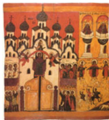
Αγία Σκέπη της Υπεραγίας Θεοτόκου Αγία Σκέπη της Υπεραγίας Θεοτόκου Αγία Σκέπη της Υπεραγίας Θεοτόκου