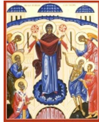
Αγία Σκέπη της Υπεραγίας Θεοτόκου Αγία Σκέπη της Υπεραγίας Θεοτόκου Αγία Σκέπη της Υπεραγίας Θεοτόκου