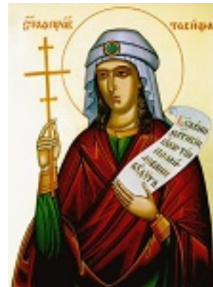
Η Αγία Ταβιθά