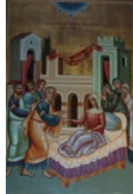
Η Αγία Ταβιθά