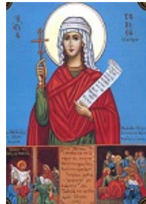
Η Αγία Ταβιθά