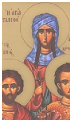
Η Αγία Ταβιθά