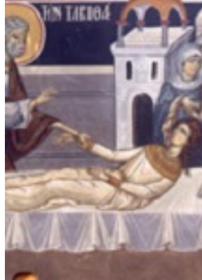
Η Αγία Ταβιθά - Ι. Ν. Ευαγγελιστού Λουκά Παρεκκλήσιον «Ιπποκρατείου» Γ. Ν. Α.