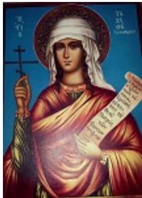
Η Αγία Ταβιθά