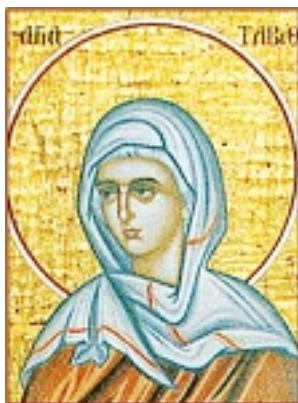
Η Αγία Ταβιθά