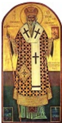
Άγιος Ευθύμιος ο Ομολογητής, επίσκοπος Σάρδεων