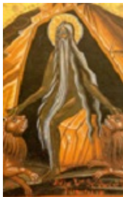
Άγιος Μακάριος ο Ρωμαίος - 18ος αι. μ.Χ. - Σκήτη Αγίας Άννης, Άγιον Όρος