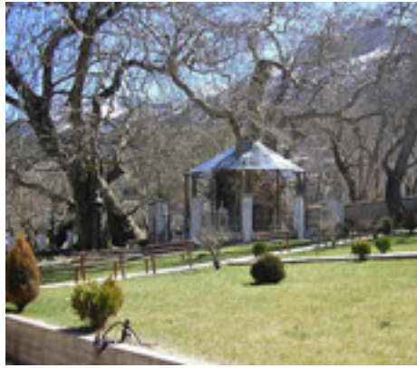
Παναγία η Πλατανιώτισσα