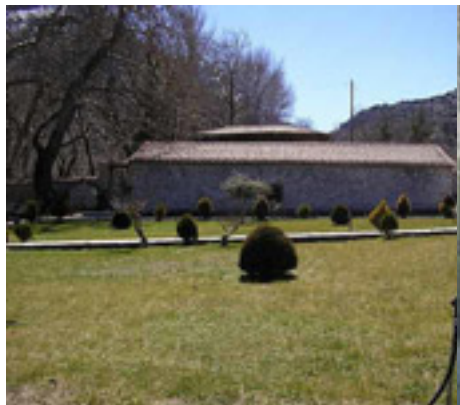
Παναγία η Πλατανιώτισσα