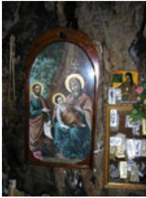
Παναγία η Πλατανιώτισσα