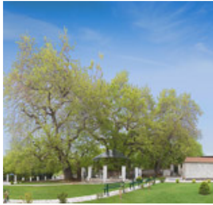
Παναγία η Πλατανιώτισσα