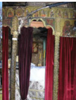
Παναγία η Πλατανιώτισσα