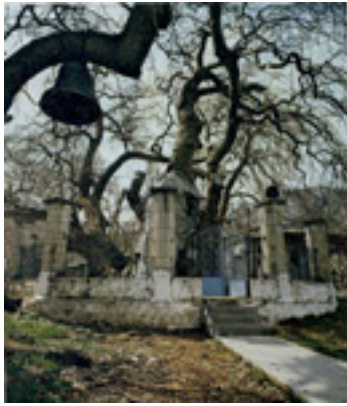
Παναγία η Πλατανιώτισσα