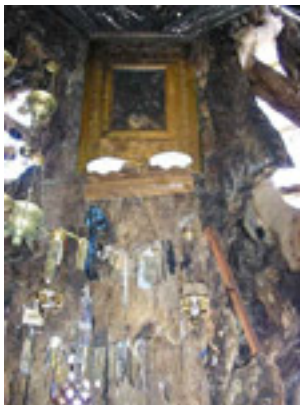
Παναγία η Πλατανιώτισσα