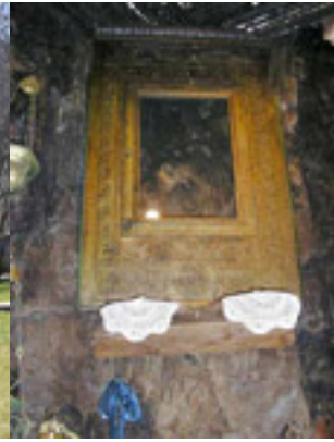
Παναγία η Πλατανιώτισσα