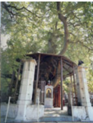
Παναγία η Πλατανιώτισσα