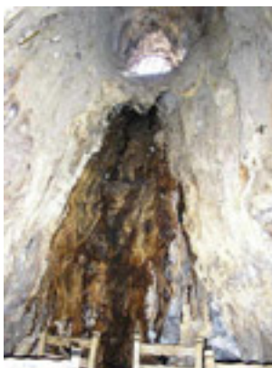
Παναγία η Πλατανιώτισσα