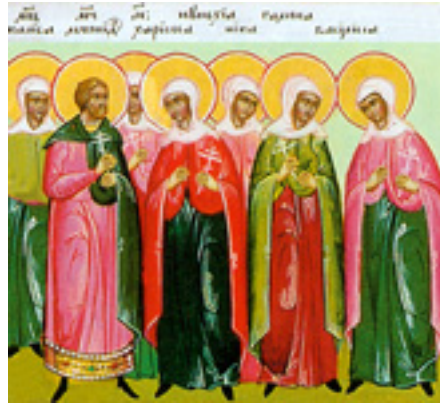
Άγιος Λεωνίδης και οι Αγίες Χάρισα, Νίκη, Γαλήνη, Καλλίδα, Νουνεχία, Βασίλισσα και Θεοδώρα