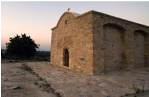
Το εκκλησάκι του Αγίου Μνάσων