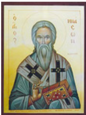
Άγιος Μνάσων ο αρχαίος μαθητής