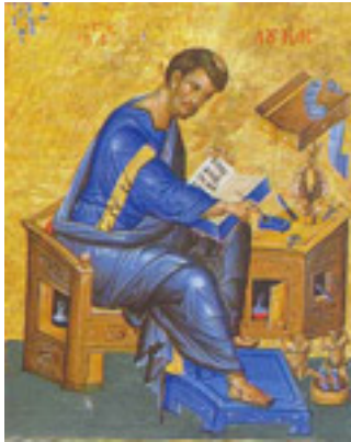
Άγιος Λουκάς ο Ευαγγελιστής