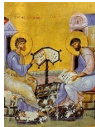
Άγιοι Λουκάς και Μάρκος (Ευαγγέλιο) - 12ος αι. μ.Χ. - Πρωτάτο, Άγιον Όρος