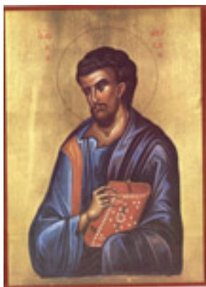
Άγιος Λουκάς ο Ευαγγελιστής