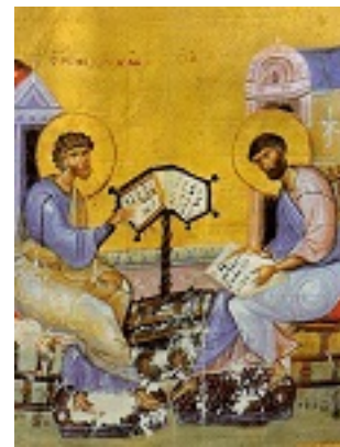
Άγιοι Λουκάς και Μάρκος (Ευαγγέλιο) - 12ος αι. μ.Χ. - Πρωτάτο, Άγιον Όρος