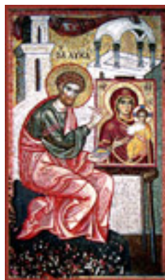
Άγιος Λουκάς ο Ευαγγελιστής