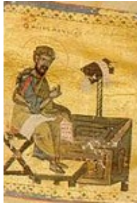
Άγιος Λουκάς ο Ευαγγελιστής (Τετραευάγγελο σε περγαμηνή) - 13ος αι. μ.Χ. - Μονή Καρακάλλου, Άγιον Όρος