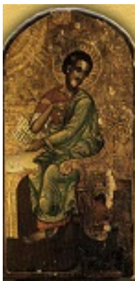
Άγιος Λουκάς ο Ευαγγελιστής - Φανάρι, Κωνσταντινούπολη