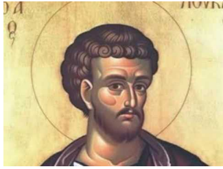
Ακούστε το απολυτίκιο!