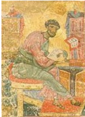
Άγιος Λουκάς ο Ευαγγελιστής (Τετραευάγγελο σε περγαμηνή) - 13ος αι. μ.Χ. - Μονή Καρακάλλου, Άγιον Όρος