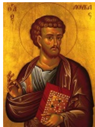
Άγιος Λουκάς ο Ευαγγελιστής