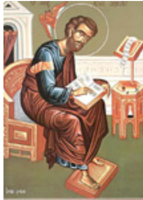
Άγιος Λουκάς ο Ευαγγελιστής