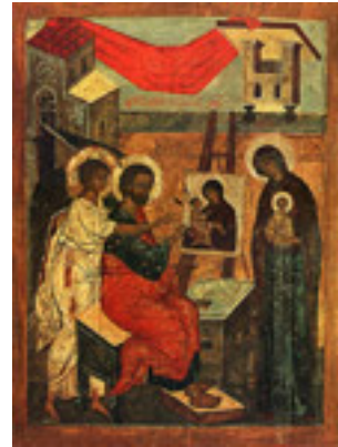
Άγιος Λουκάς ο Ευαγγελιστής