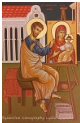
Άγιος Λουκάς ο Ευαγγελιστής - Λυδία Γουριώτη© ( http://lydiagourioti- iconography.blogspot.com )