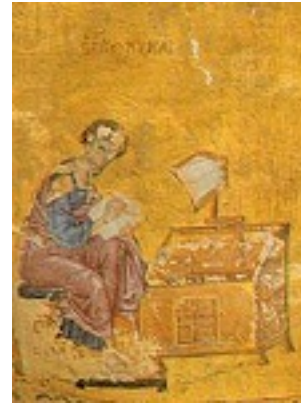
Άγιος Λουκάς ο Ευαγγελιστής (Τετραευάγγελο) - 13ος αι. μ.Χ. - Μονή Ξηροποτάμου, Άγιον Όρος