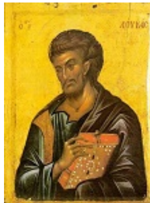
Άγιος Λουκάς ο Ευαγγελιστής - γ' τέταρτο 14ου αι. μ.Χ. - Μονή Χιλανδαρίου, Άγιον Όρος