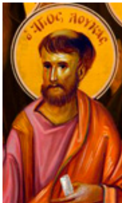
Άγιος Λουκάς ο Ευαγγελιστής