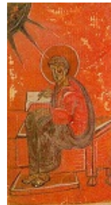
Άγιος Λουκάς ο Ευαγγελιστής (Τετραευάγγελο) - 14ος αι. μ.Χ. - Μονή Κουτλουμουσίου, Άγιον Όρος