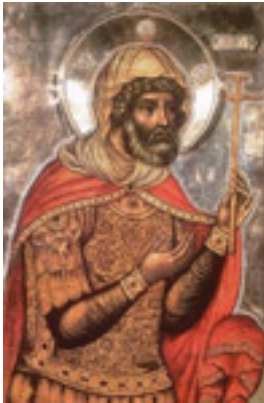
Άγιος Λογγίνος ο Εκατόνταρχος