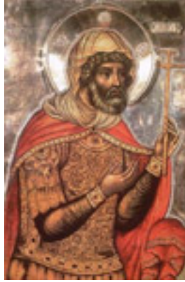
Άγιος Λογγίνος ο Εκατόνταρχος