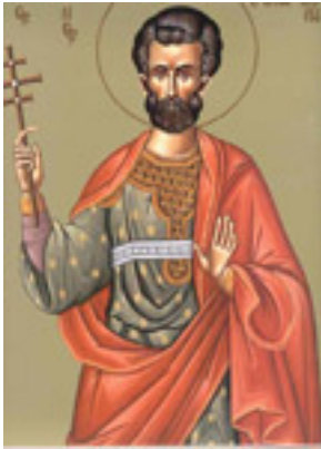
Άγιος Λογγίνος ο Εκατόνταρχος