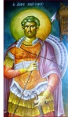
Άγιος Λογγίνος ο Εκατόνταρχος