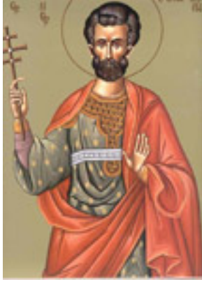
Άγιος Λογγίνος ο Εκατόνταρχος