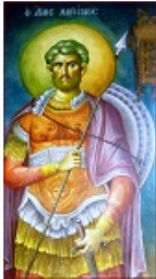
Άγιος Λογγίνος ο Εκατόνταρχος