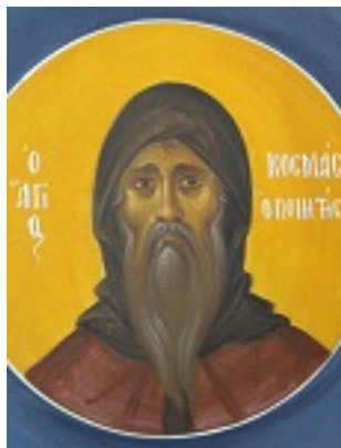
Άγιος Κοσμάς ο Μελωδός επίσκοπος Μαΐουμά - Ι. Ν. Οσίων Παρθενίου και Ευμενίου των εν Κουδουμά, δια χειρός Παναγιώτη Μόσχου (2006 μ.Χ.)