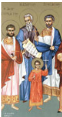
Άγιοι Ναζάριος, Προτάσιος, Γερβάσιος και Κέλσιος