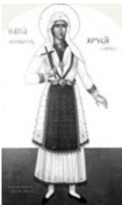
Αγία Χρυσή η Νεομάρτυς