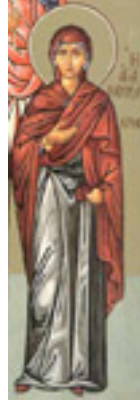
Αγία Χρυσή η Νεομάρτυς