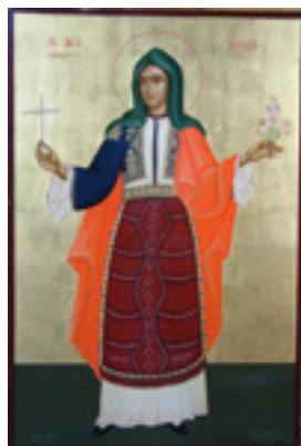
Αγία Χρυσή η Νεομάρτυς