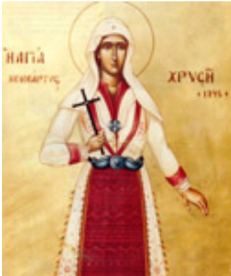
Αγία Χρυσή η Νεομάρτυς