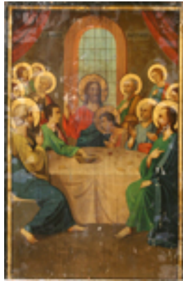
Μυστικός Δείπνος - Ι.Ν. Ζωοδόχου Πηγής, Λαρίσης ( http://www.panagialarisis.gr )