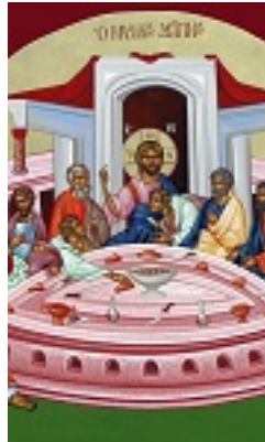
Μυστικός Δείπνος - Μιχαήλ Χατζημιχαήλ© www.michaelhadjimichael.com