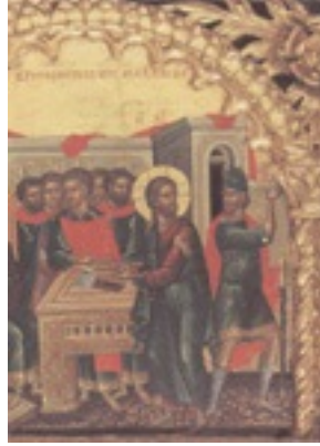
Ο Ιησούς κρινόμενος από τον Καϊάφα