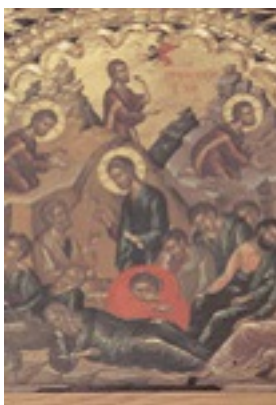
Η προσευχή του Ιησού