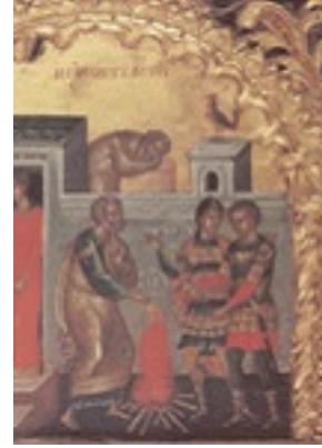
Η άρνηση του Πέτρου