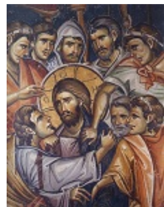
Τό φιλί τού Ιούδα - Τοιχογραφία από την Ιερά Μονή Βατοπαιδίου