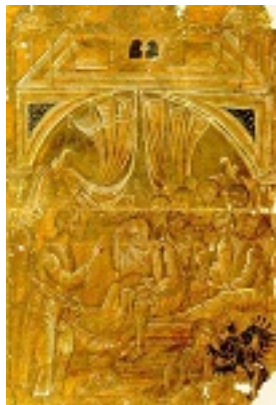
Ο Νυπτήρας - 16ος αι. μ.Χ. - Μονή Διονυσίου, Άγιον Όρος