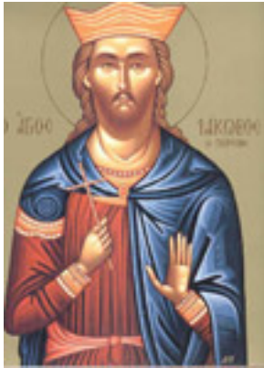
Άγιος Ιάκωβος ο Πέρσης ο Μεγαλομάρτυρας