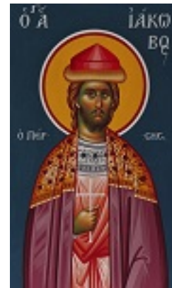
Άγιος Ιάκωβος ο Πέρσης ο Μεγαλομάρτυρας