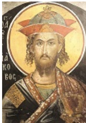
Άγιος Ιάκωβος ο Πέρσης ο Μεγαλομάρτυρας - Τοιχογραφία του καθολικού της Ιεράς Μονής Αγίου Νικολάου Αναπαυσά