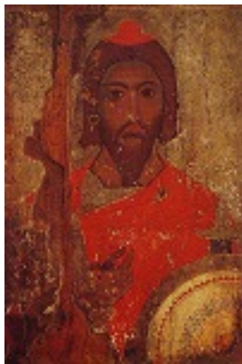
Άγιος Ιάκωβος ο Πέρσης ο Μεγαλομάρτυρας (12ος αί.) - Κάτω Πάφος