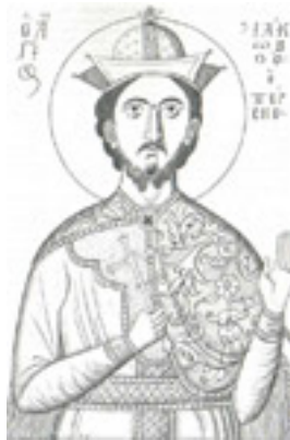
Άγιος Ιάκωβος ο Πέρσης ο Μεγαλομάρτυρας