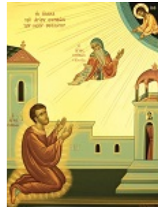
Το όραμα του Οσίου Συμεών του Νέου Θεολόγου