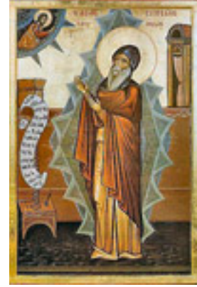
Όσιος Συμεών ο Νέος Θεολόγος