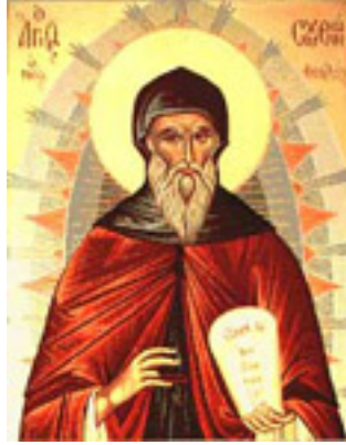
Όσιος Συμεών ο Νέος Θεολόγος