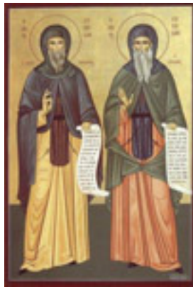
Όσιοι Συμεών ο Νέος Θεολόγος και Συμεών ο Ευλαβής