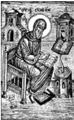
Όσιος Συμεών ο Νέος Θεολόγος - Φώτης Κόντογλου