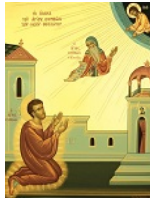
Το όραμα του Οσίου Συμεών του Νέου Θεολόγου