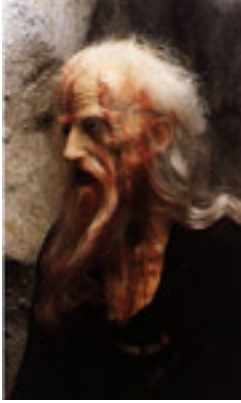
Κέρινο ομοίωμα που />φιλοτεχνήθηκε από<br />τον Παύλο Βρέλλη