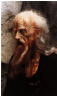
Κέρινο ομοίωμα που />φιλοτεχνήθηκε από<br />τον Παύλο Βρέλλη