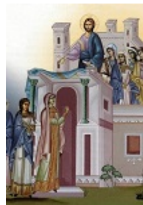
Μεγάλη Τρίτη - Των Δέκα Παρθένων Μεγάλη Τρίτη - Των Δέκα Παρθένων Μεγάλη Τρίτη - Των Δέκα Παρθένων