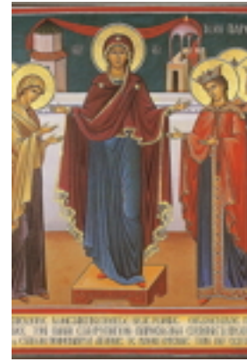
Μεγάλη Τρίτη - Των Δέκα Παρθένων Μεγάλη Τρίτη - Των Δέκα Παρθένων Μεγάλη Τρίτη - Των Δέκα Παρθένων