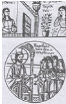
Μεγάλη Τρίτη - Των Δέκα Παρθένων Μεγάλη Τρίτη - Των Δέκα Παρθένων