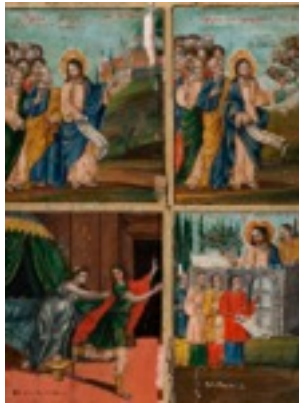
Αρχή της Μεγάλης Εβδομάδας