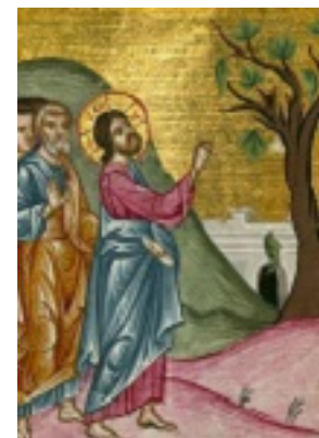
Η ξηρανθείσα συκή