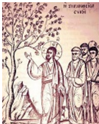
Η ξηρανθείσα συκή