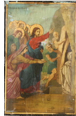
Ανάσταση του Λαζάρου - Ι.Ν. Ζωοδόχου Πηγής, Λαρίσης