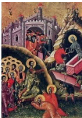
Η έγερση του δικαίου Λαζάρου. 16ος αι. Ι.Ναός Ευαγγελισμού, Βερατίου Αλβανίας