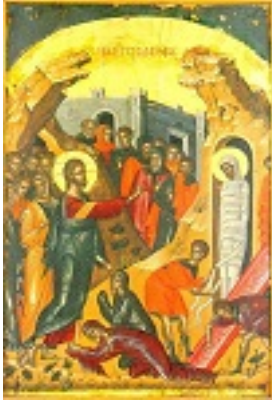
Η έγερση του Λαζάρου - 1546 μ.Χ. - Μονή Σταυρονικήτα, Άγιον Όρος (Κρητική σχολή, Θεοφάνης ο Κρής)