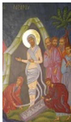
Ανάσταση του Λαζάρου - Ήσυχαστήριο «Παναγία των Βρυούλων»