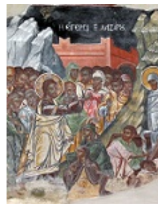
Ανάσταση του Λαζάρου