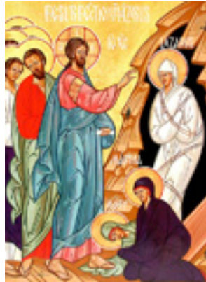
Ανάσταση του Λαζάρου