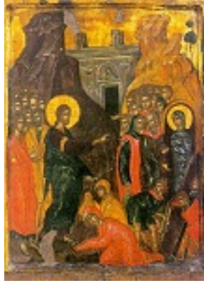
Η έγερση του Λαζάρου - 15ος - 16ος αι. μ.Χ. - Πρωτάτο, Άγιον Όρος