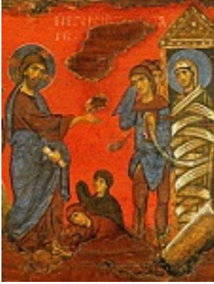
Ανάσταση του Λαζάρου