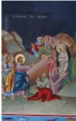
Η έγερση του Λαζάρου - Νικόλαος Παπαδόπουλος