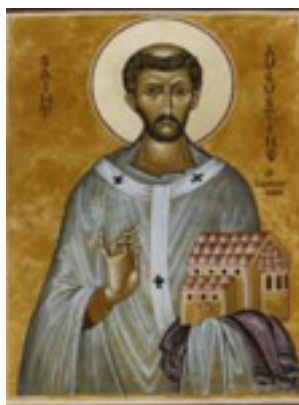
Άγιος Αυγουστίνος Αρχιεπίσκοπος Καντουαρίας