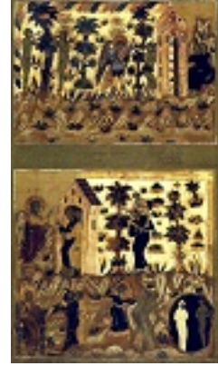
Η εξορία των Πρωτοπλάστων