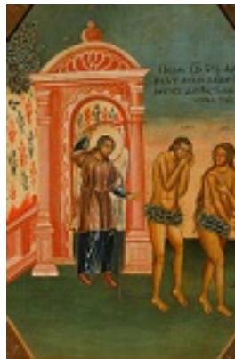
Η εξορία των Πρωτοπλάστων