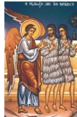
Η εξορία των Πρωτοπλάστων