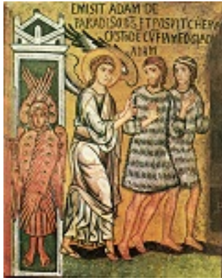
Η εξορία των Πρωτοπλάστων