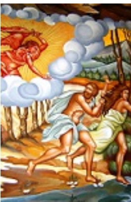
Η εξορία των Πρωτοπλάστων