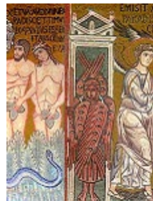
Η εξορία των Πρωτοπλάστων