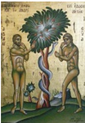
Η εξορία των Πρωτοπλάστων