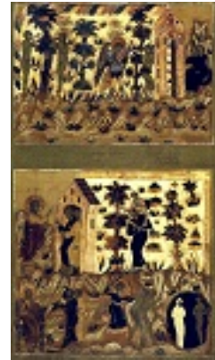
Η εξορία των Πρωτοπλάστων