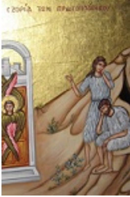
Η εξορία των Πρωτοπλάστων