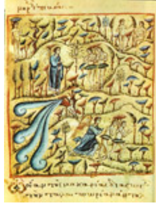
Η εξορία των Πρωτοπλάστων