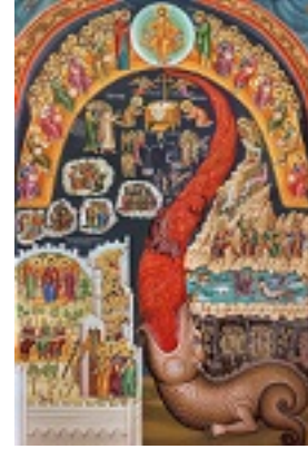
Δευτέρα παρουσία - Μονή Αγίου Στεφάνου Μετεώρων