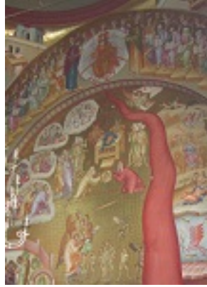
Δευτέρα παρουσία - Καπερναούμ, Μονή Αγίων Αποστόλων