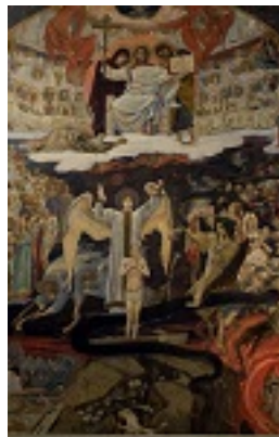
Δευτέρα παρουσία - Ρωσία, 1904 μ.Χ.