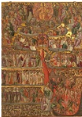
Δευτέρα παρουσία - Γεώργιος Κλόντζας, τέλη 16ου αιώνα μ.Χ.