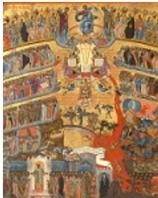
Δευτέρα παρουσία - Φραγκιάς Καβερτζάς, 1640 - 1641 μ.Χ.