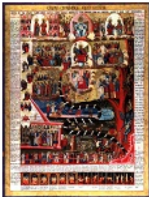
Δευτέρα παρουσία - Ρωσία, 18ος αιώνας μ.Χ.