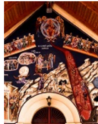
Δευτέρα παρουσία - Κοιμητήριον Αγίου