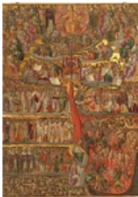
Δευτέρα παρουσία - Γεώργιος Κλόντζας, τέλη 16ου αιώνα μ.Χ.