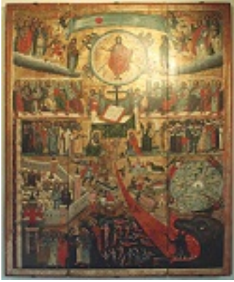
Δευτέρα παρουσία - Πολωνία, 17ος αιώνας μ.Χ.