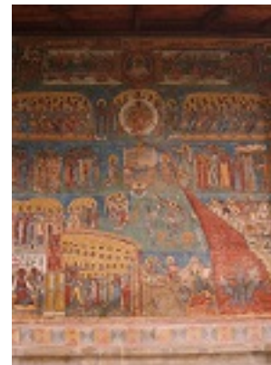
Δευτέρα παρουσία - Ρουμανία