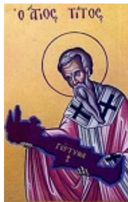
Άγιος Τίτος ο Απόστολος