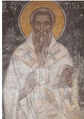
Άγιος Τίτος ο Απόστολος - Τοιχογραφία του 14ου αι. μ.Χ. από τον Ι. Ν. Αγ. Φωτεινής, της Ι. Μ. Πρέβελης