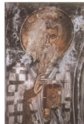
Άγιος Τίτος ο Απόστολος - Τοιχογραφία περί το 1280 μ.Χ., από τον Ι. Ν. Αγ. Νικολάου, Μονής Σελίνου