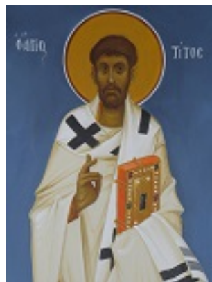
Άγιος Τίτος ο Απόστολος - Ι. Ν. Οσίων Παρθενίου και Ευμενίου των εν Κουδουμά, δια χειρός Παναγιώτη Μόσχου (2006 μ.Χ.)