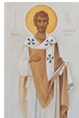
Άγιος Τίτος ο Απόστολος