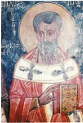
Άγιος Τίτος ο Απόστολος - Τοιχογραφία του 1327 μ.Χ. από παλιά Εκκλησία της Κρήτης