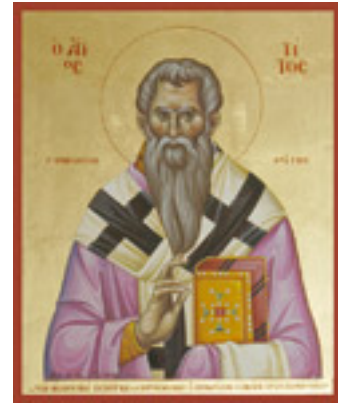
Άγιος Τίτος ο Απόστολος