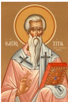
Άγιος Τίτος ο Απόστολος