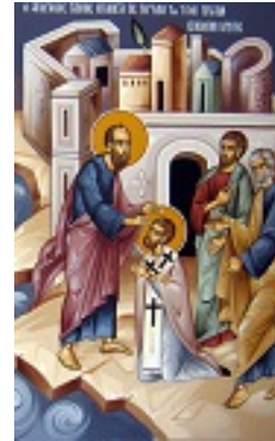
Άγιος Τίτος ο Απόστολος