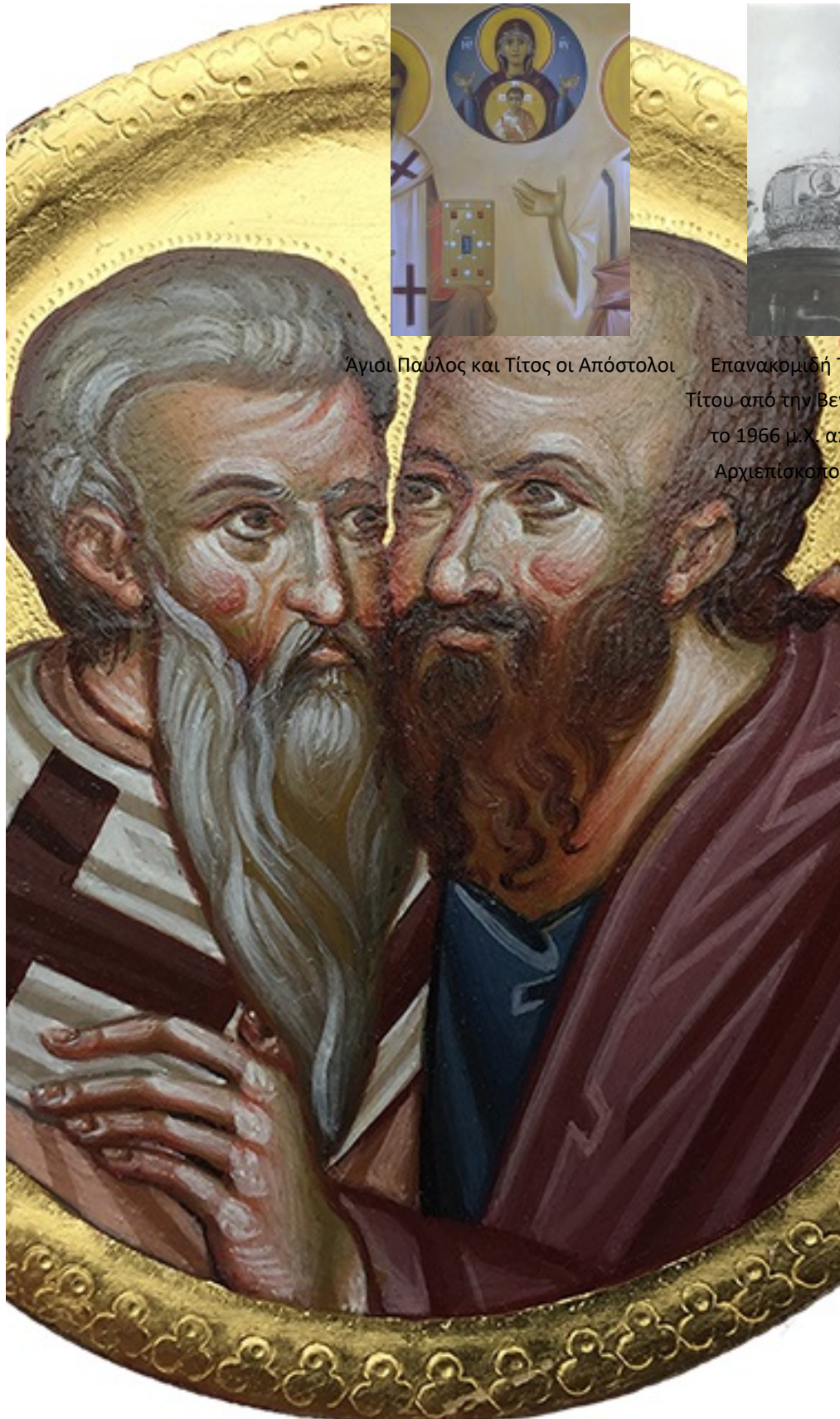
Άγιοι Παύλος και Τίτος οι Απόστολοι

Επινακομιδή Τιμίας Κάρας Αγ. Τίτου από την Βενετία στο Ηράκλειο το 1966 μ.Χ. από το μακαριστό Αρχιεπίσκοπο Κρήτης Ευγένιο