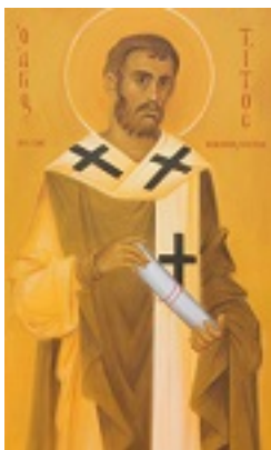
Άγιος Τίτος ο Απόστολος