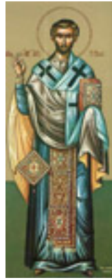
Άγιος Τίτος ο Απόστολος