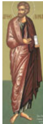
Άγιος Βαρθολομαίος ο Απόστολος