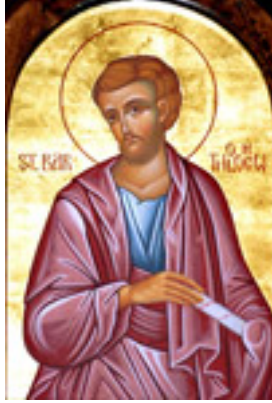
Άγιος Βαρθολομαίος ο Απόστολος