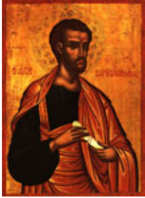
Άγιος Βαρθολομαίος ο Απόστολος