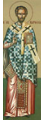
Άγιος Βαρθολομαίος ο Απόστολος