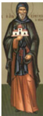
Άγιος Ευθύμιος ο Νέος