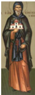
Άγιος Ευθύμιος ο Νέος