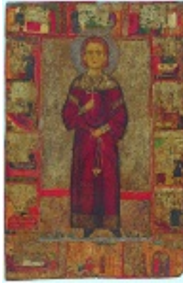
Όσιος Ιωάννης ο Λαμπαδιστής - Φορητή Εικόνα 13ου αιώνα μ.Χ.