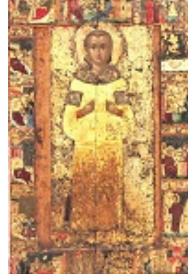
Όσιος Ιωάννης ο Λαμπαδιστής