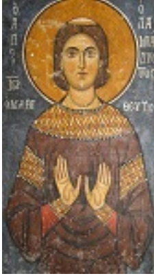
Όσιος Ιωάννης ο Λαμπαδιστής