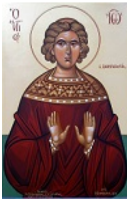
Όσιος Ιωάννης ο Λαμπαδιστής - Μιχαήλ Χατζημιχαήλ© www.michaelhadjimichael.com