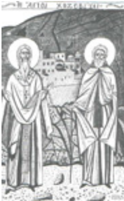
Οι Άγιοι Χοζεβίται