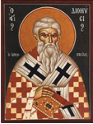
Άγιος Διονύσιος ο Αρεοπαγίτης