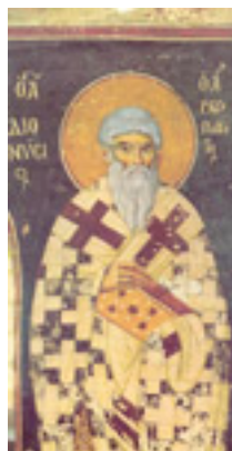
Άγιος Διονύσιος ο Αρεοπαγίτης