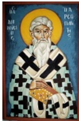
Άγιος Διονύσιος ο Αρεοπαγίτης - Αγγελική Τσέλιου© (diaxeirosaggelikistseliou. blogspot.com)