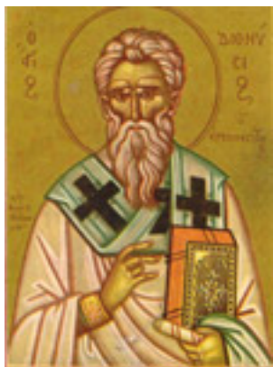
Άγιος Διονύσιος ο Αρεοπαγίτης