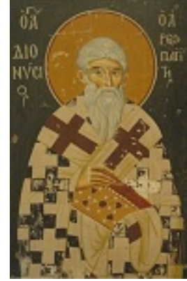
Άγιος Διονύσιος ο Αρεοπαγίτης