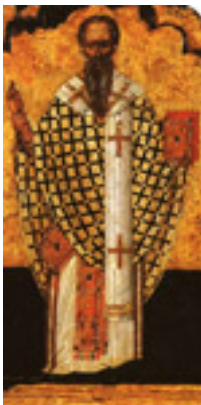
Άγιος Διονύσιος ο Αρεοπαγίτης