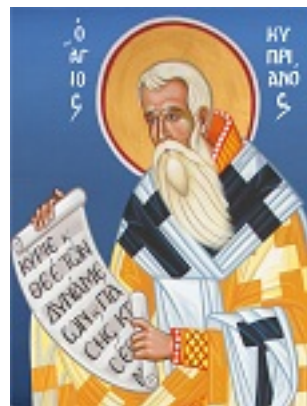
Άγιος Κυπριανός - Καζακίδου Μαρία© (byzantineartkazakidou. blogspot.com)