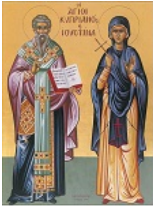
Άγιος Κυπριανός και Αγία Ιουστίνη