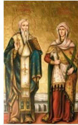
Άγιος Κυπριανός και Αγία Ιουστίνη