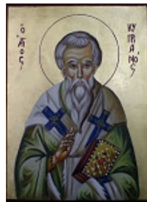
Άγιος Κυπριανός