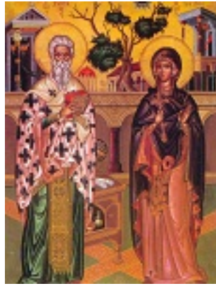
Άγιος Κυπριανός και Αγία Ιουστίνη