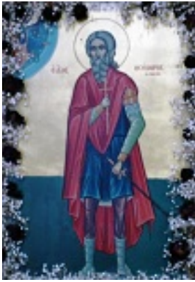
Άγιος Θεόδωρος ο Μεγαλομάρτυρας ο Γαβράς