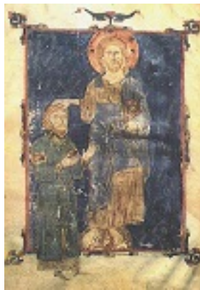
Άγιος Θεόδωρος ο Μεγαλομάρτυρας ο Γαβράς (Από τετραευαγγέλιο του 1067 μ.Χ.)