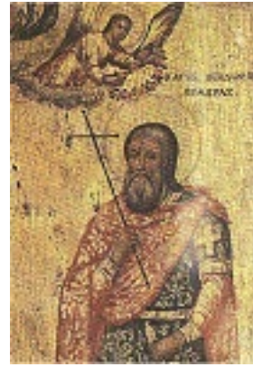
Άγιος Θεόδωρος ο Μεγαλομάρτυρας ο Γαβράς