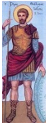
Άγιος Θεόδωρος ο Μεγαλομάρτυρας ο Γαβράς