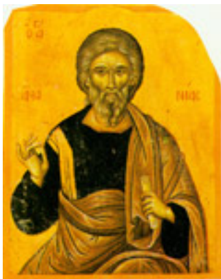
Άγιος Ανανίας ο Απόστολος