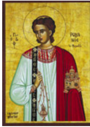
Όσιος Ρωμανός ο Μελωδός