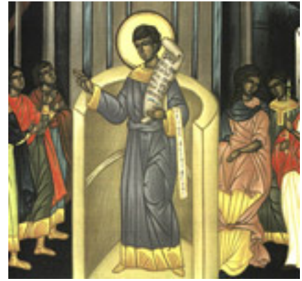
Όσιος Ρωμανός ο Μελωδός