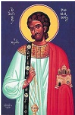
Όσιος Ρωμανός ο Μελωδός