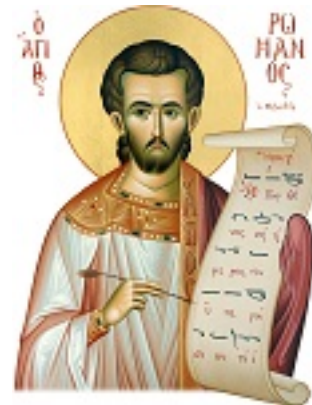
Όσιος Ρωμανός ο Μελωδός