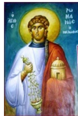
Όσιος Ρωμανός ο Μελωδός