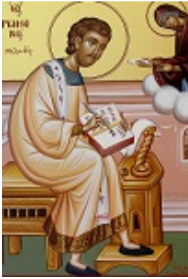
Όσιος Ρωμανός ο Μελωδός