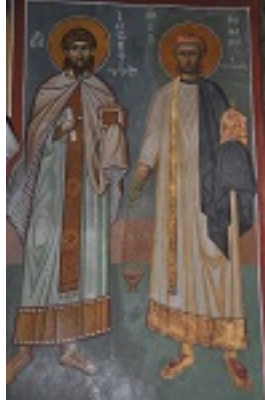
Ο Άγιος Ρωμανός ο Μελωδός και ο Άγιος Ιωσήφ ο Υμνογράφος, ναός Καπνικαρέας