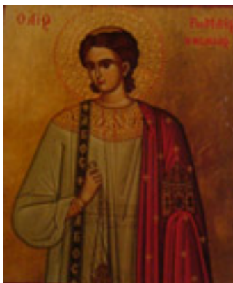
Όσιος Ρωμανός ο Μελωδός