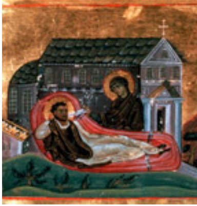
Το όραμα του Ρωμανού (Codex Vaticanus graecus 1613)