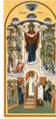
Αγία Σκέπη της Υπεραγίας Θεοτόκου Αγία Σκέπη της Υπεραγίας Θεοτόκου Αγία Σκέπη της Υπεραγίας Θεοτόκου