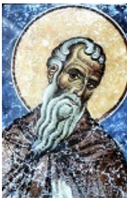
Όσιος Ιλαρίων ο Μέγας