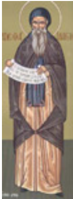
Όσιος Ιλαρίων ο Μέγας