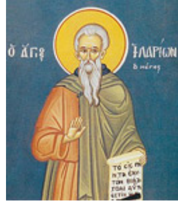
Όσιος Ιλαρίων ο Μέγας