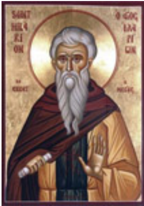
Όσιος Ιλαρίων ο Μέγας