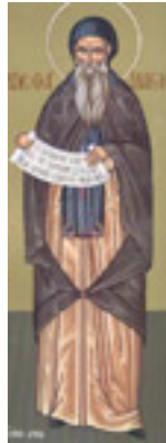
Όσιος Ιλαρίων ο Μέγας