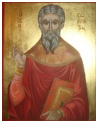
Άγιος Σωκράτης ο Πρεσβύτερος - Ελένη Παντελη©