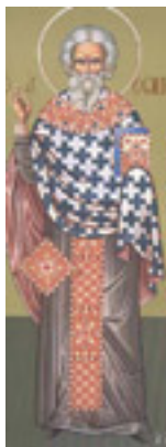
Άγιος Σωκράτης ο Πρεσβύτερος