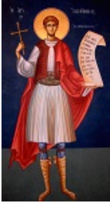
Άγιος Ιωάννης ο Νεομάρτυρας από τη Μονεμβασιά