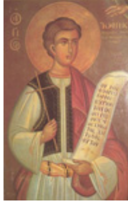
Άγιος Ιωάννης ο Νεομάρτυρας από τη Μονεμβασιά