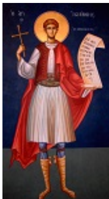
Άγιος Ιωάννης ο Νεομάρτυρας από τη Μονεμβασιά