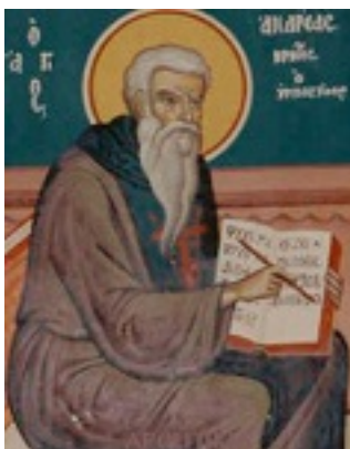
Ἅγιος Ἀνδρέας ὁ Ὁσιομάρτυρας «Ὁ ἐν τῇ Κρίσει»