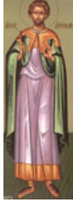
Άγιος Αρέθας ο Μεγαλομάρτυρας