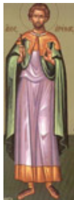
Άγιος Αρέθας ο Μεγαλομάρτυρας